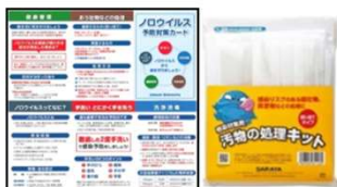
ノロウイルス 予防対策カード ノロウイルス対策 汚物の処理キット