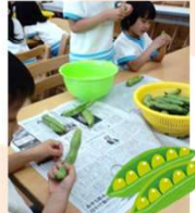
6月：そら豆のさやむき