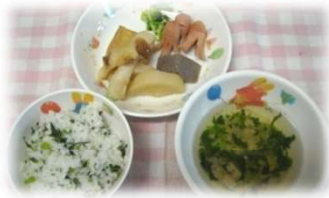
11月の「大根まるごとデー」