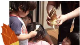
4月：たけのこの皮むき