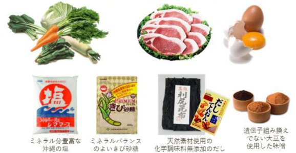
ミネラル分豊富な 沖縄の塩