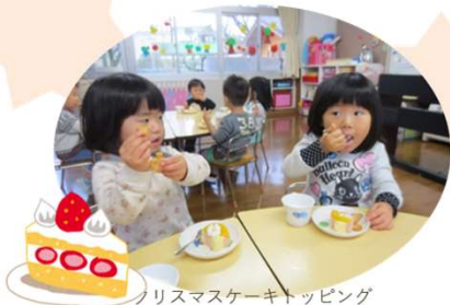
クリスマスケーキトッピング