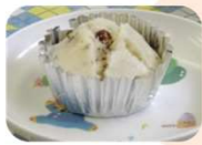
鉄分たっぷり 「レーズン蒸しパン」