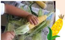
7月：とうもろこしの皮むき