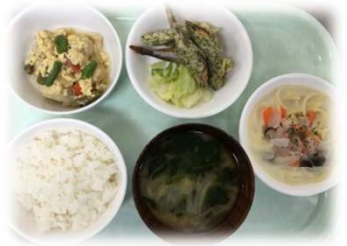
カルシウムたっぷりシシャモは、 磯部揚げで骨まで美味しく