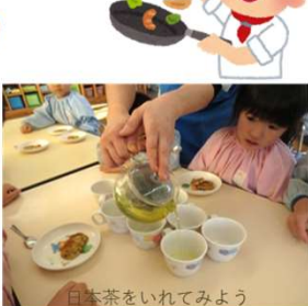
日本茶をいれてみよう